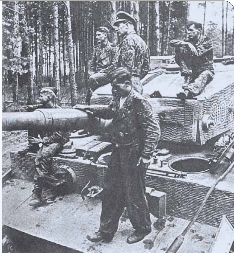
Odpoczywająca załoga Tygrysa numer 901 z 9 kompanii czołgów ciężkich

Na przełomie września i października przypada kolejna, już 66 rocznica wyzwolenia terenów naszej gminy spod okupacji hitlerowskiej, dlatego dzisiaj wspomnę o toczonych w tych miesiącach 1944 roku przez Armię Czerwoną i Ludowe Wojsko Polskie, krwawych walkach w północnym sektorze frontu pod Warszawą.