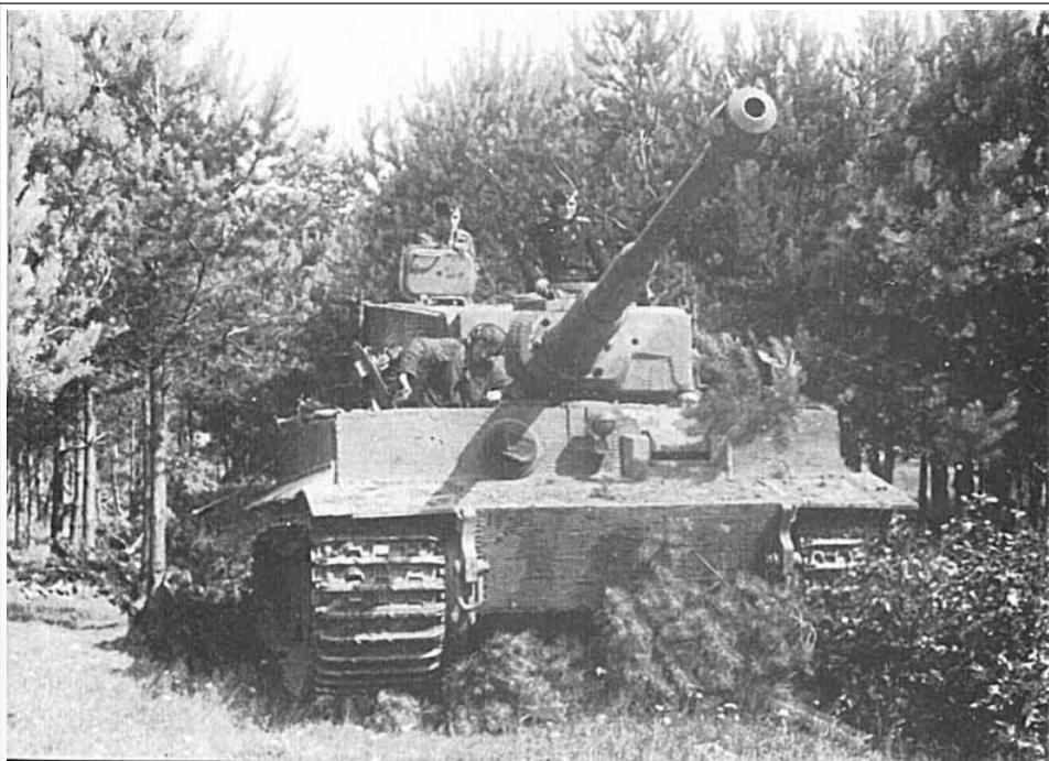
Tygrys numer 912 z 9 kompanii czołgów ciężkich zajmuje stanowisko bojowe (źródło: Bruce Quarrie „Waffen-SS in Russia” wyd PSL 1988)

Na przełomie września i października przypada kolejna, już 66 rocznica wyzwolenia terenów naszej gminy spod okupacji hitlerowskiej, dlatego dzisiaj wspomnę o toczonych w tych miesiącach 1944 roku przez Armię Czerwoną i Ludowe Wojsko Polskie, krwawych walkach w północnym sektorze frontu pod Warszawą.