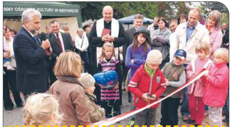
PLAC ZABAW W STANISŁAWOWIE DRUGIM