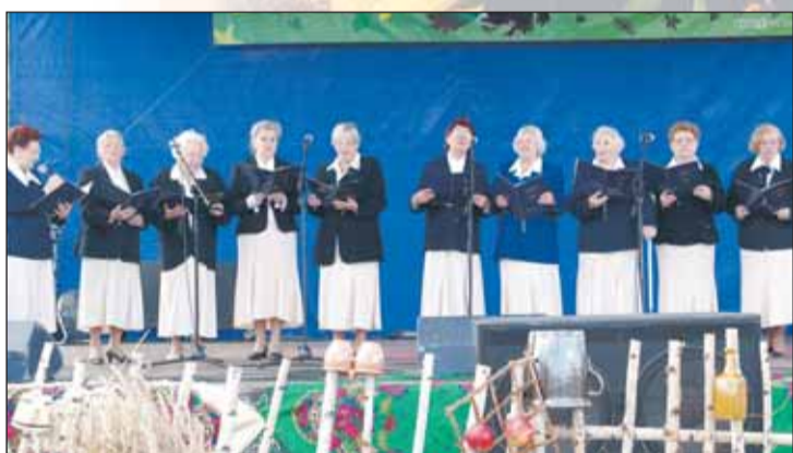
Śpiewa grupa Zegrzynianki z Zegrza Południowego