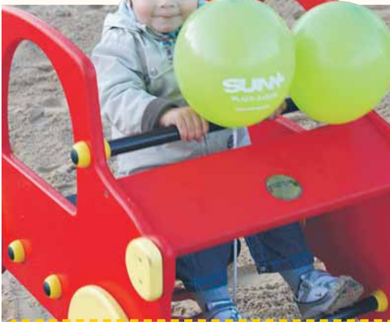
PLAC ZABAW W KĄTACH WĘGERSKICH

We wrześniu otwarte zostały na terenie gminy trzy place zabaw dla dzieci – w Kątach Węgerskich, Stanisławowie Drugim i Beniaminowie.