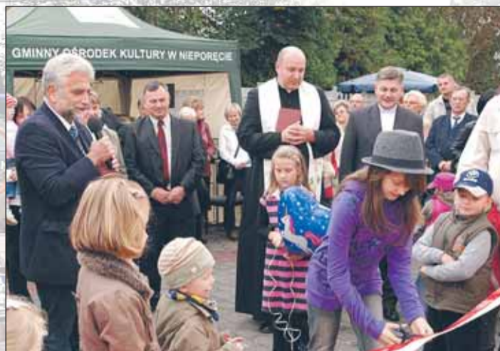
Uroczyste otwarcie placu zabaw

W niedzielę 19 września mieszkańcy Stanisławowa Drugiego, Woli Aleksandra oraz ich goście bawili się na Pikniku Rodzinnym.