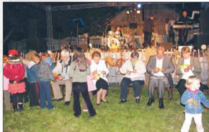
Kto ma najrzęczniejsze dłonie, czyli konkurs wycinanek