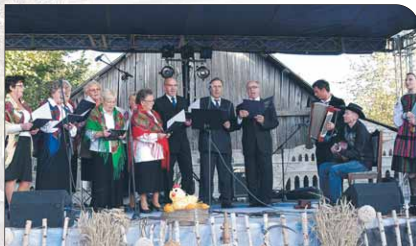
Występ zespołu wokalnego ze Stanisławowa Drugiego