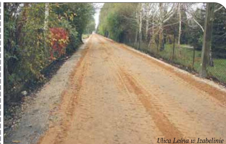
Ulica Leśna w Izabelinie

W Józefowie i Izabelinie trwają prace budowlane na ulicach o wspólnej nazwie – Leśna.