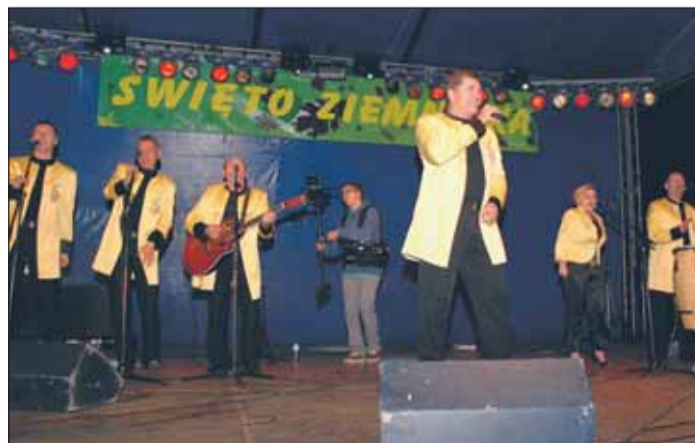
Na scenie zespół Bayer Full