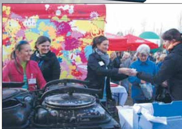
Grochówka cieszyła się wielkim powodzeniem