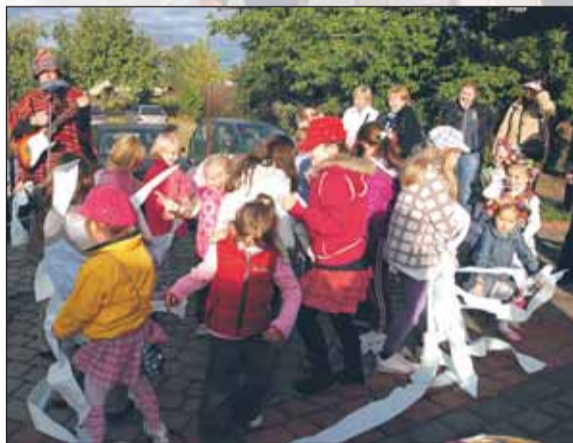
Zabawa z zespołem „Puf, puf”