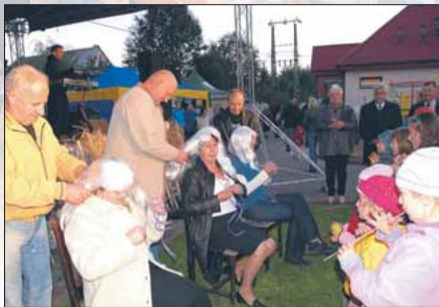
Który pan najszybciej zaplecie warkocze...